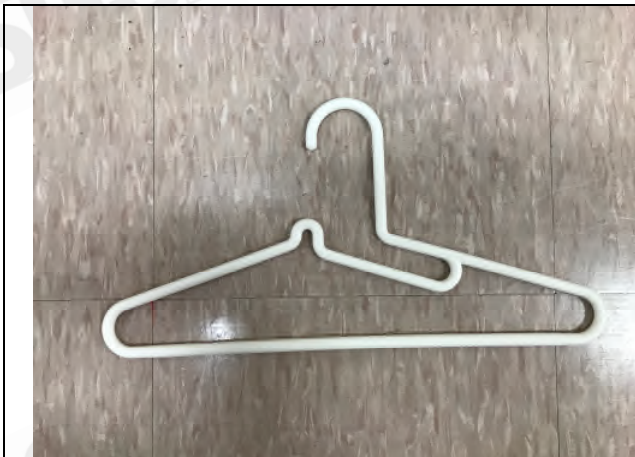
照片 A：測試樣品外觀